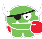
TARTAR THE TERRIBLE