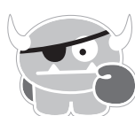
TARTAR THE TERRIBLE